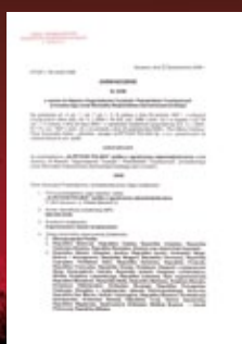
Zaświadczenie nr 34/08 Marszałka Województwa Zachodniopomorskiego o wpisie do Rejestru Organizatorów Turystyki i Pośredników Turystycznych