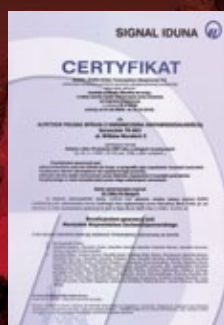
Gwarancja ubezpieczeniowa turystyczna Signal Iduna Polska Towarzystwo Ubezpieczeń SA