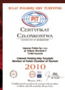
Jesteśmy członkiem Polskiej Izby Turystyki